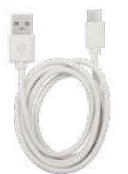
USB ケーブル (TypeA-TypeC)