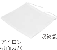
アイロン かけ面カバー